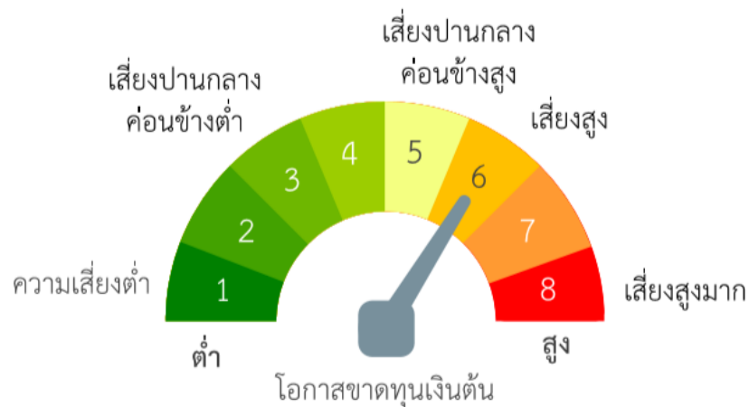
แผนภาพแสดงตำแหน่งความเสี่ยงของนโยบายการลงทุน